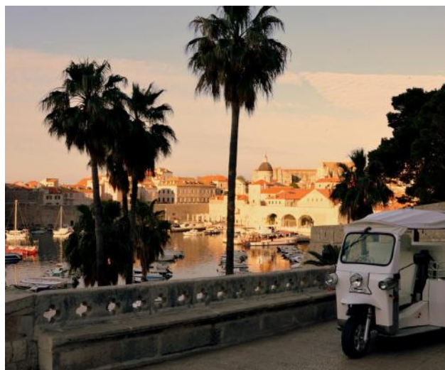
10. TOUR AL TRAMONTO IN ECO TUK-TUK PRENOTA QUI WAPP: +385915733935