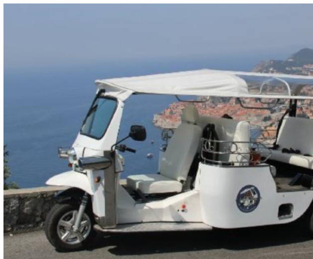
11. TOUR DI TRE ORE IN ECO TUK-TUK PRENOTA QUI WAPP: +385915733935