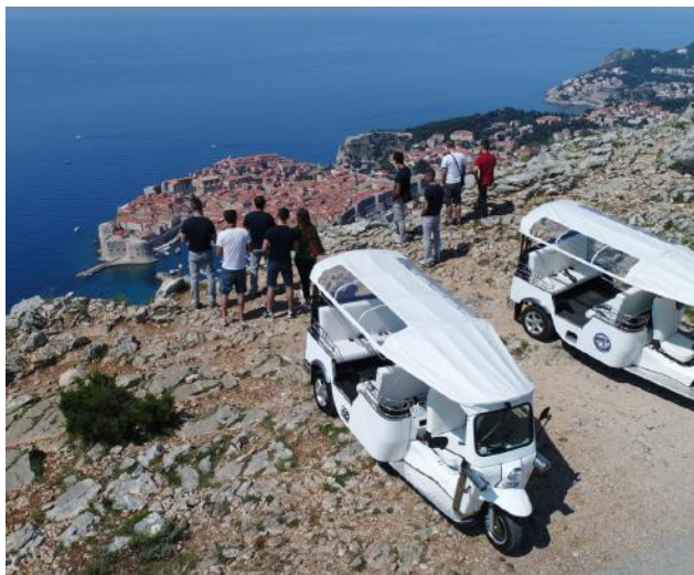
9. TOUR DI DUBROVNIK IN ECO TUK-TUK PRENOTA QUI WAPP: +385915733935