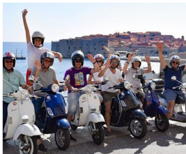
12. TOUR IN VESPA PRENOTA QUI WAPP: +385915733935